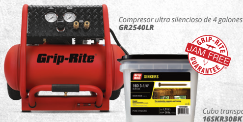
Compresor ultra silencioso de 4 galones GR2540LR

Las herramientas Grip-Rite® ofrecen los mejores resultados cuando se utilizan con compresores, sujetadores y accesorios Grip-Rite®.