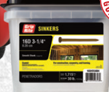
16D Coated Sinker 30# Clear Bucket 16SKR30BK