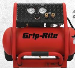
4 Gallon Ultra Quiet Compressor GR2540LR

Grip-Rite® tools deliver the best results when used with Grip-Rite® compressors, fasteners and accessories.