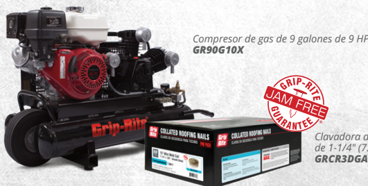
Compresor de gas de 9 galones de 9 HP GR90G10X

Las herramientas Grip-Rite® ofrecen los mejores resultados cuando se utilizan con compresores, sujetadores y accesorios Grip-Rite®.