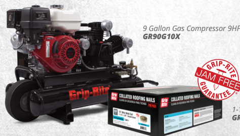
9 Gallon Gas Compressor 9HP GR90G10X

Grip-Rite® tools deliver the best results when used with Grip-Rite® compressors, fasteners and accessories.