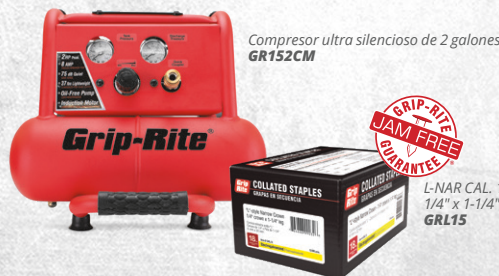
Compresor ultra silencioso de 2 galones GR152CM

Grip-Rite® respalda todos sus herramientas neumáticas con la promesa RED™: una garantía y un programa de servicio líder en la industria que incluye una garantía de 7 años para herramientas y una red nacional de servicio.