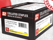
L-NAR CAL. 18, 1/4" x 1-1/4" GALV. 5M GRL15

Las herramientas Grip-Rite® ofrecen los mejores resultados cuando se utilizan con compresores, sujetadores y accesorios Grip-Rite®.