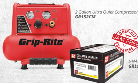
2 Gallon Ultra Quiet Compressor GR152CM

Grip-Rite® tools deliver the best results when used with Grip-Rite® compressors, fasteners and accessories.