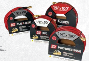
Manguera de aire hecha de poliuretano GRPUR14100