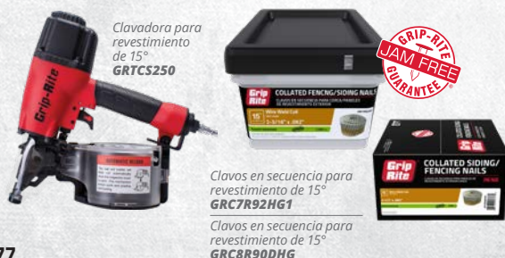
Clavadora para revestimiento de 15° GRTCS250

Las herramientas Grip-Rite® ofrecen los mejores resultados cuando se utilizan con compresores, sujetadores y accesorios Grip-Rite®.