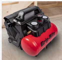
DESIGNED FOR TRIM, CARPENTRY AND OTHER SMALL PROJECTS.