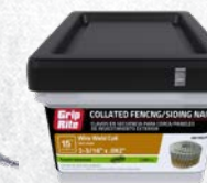
Clavos en secuencia para revestimiento de 15° GRC7R92HG1